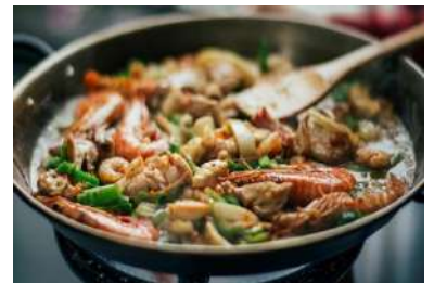
PAELLAS Y ARROCES