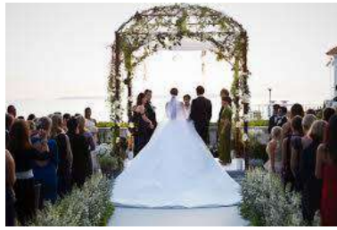
BODAS BAUTIZOS Y COMUINIONES