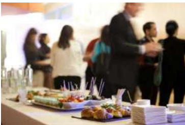
EMPRESAS TAKE AWAY