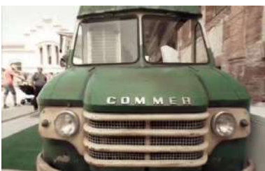
SÚMMUM FOOD TRUCK