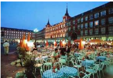
RUTA DE TAPAS