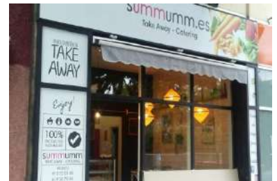
SUMMUM TAKE AWAY